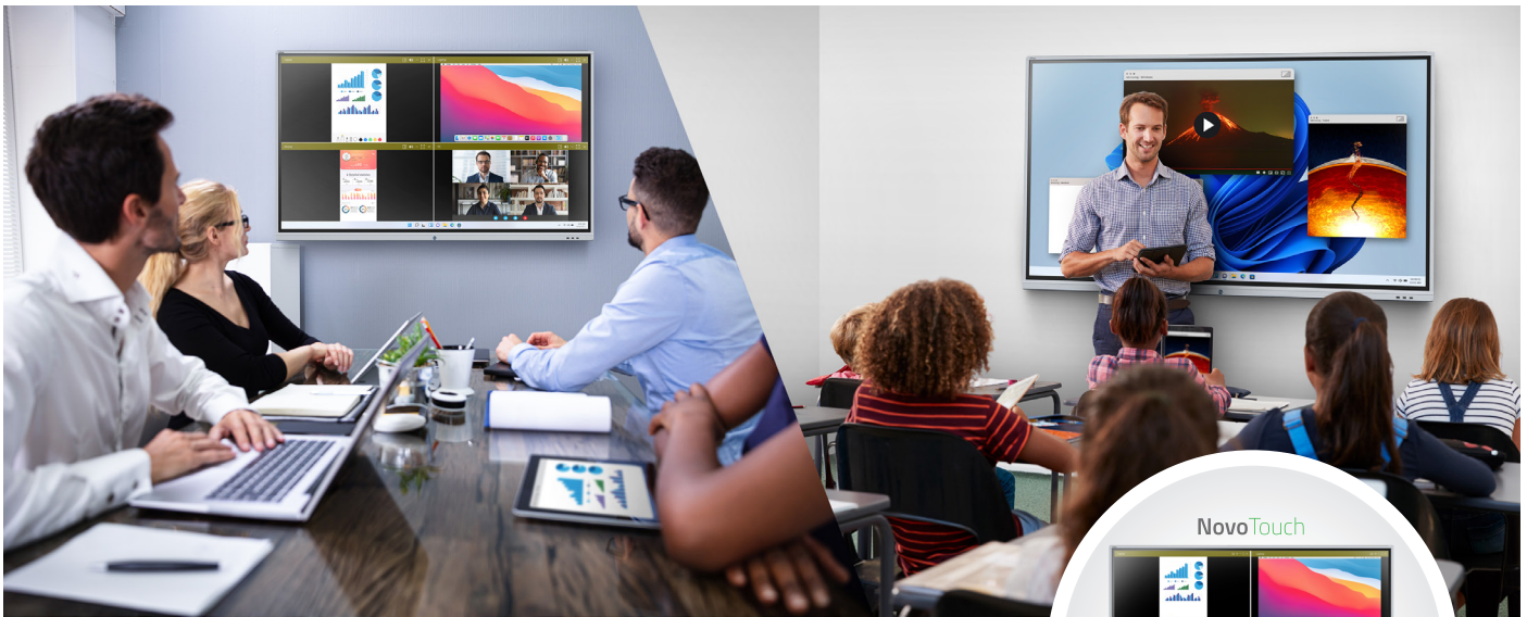
NovoTouch mit OPS-Modul (VKW30-i7)